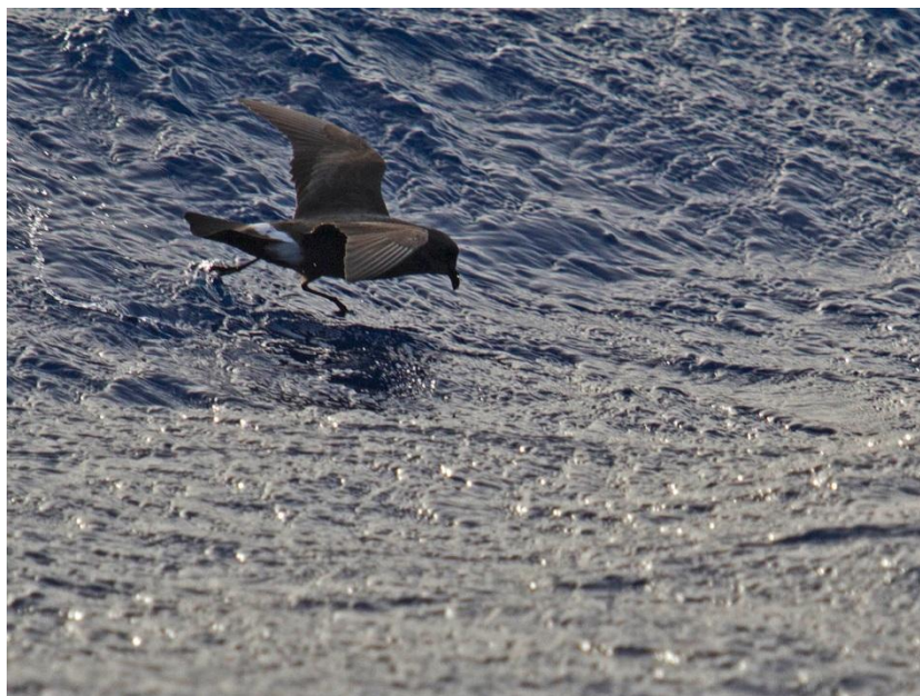
Madeira Stormvogeltje 1