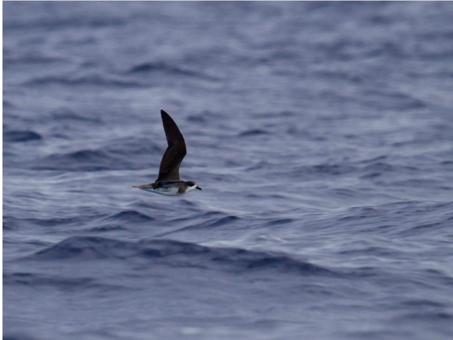
Zino's Petrel - Pterodroma madeira

S'morgens ge-ontbijt en wat rond gelopen in Funchal om daarna richting het vliegveld te gaan om de auto in te leveren en om met het vliegtuig naar huis te gaan. Om 17.00 uur vertrok de vliegtuig en rond 23.30 uur lande die in schip ( ook weer over stap gehad in Lissabon). De Taxie zou er om 0.30 uur zijn en om 3.00 uur waren we terug in Nederweert.